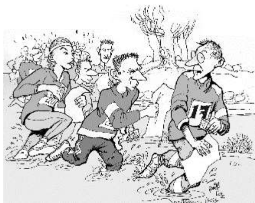
Piirrokset Risto Oikarinen