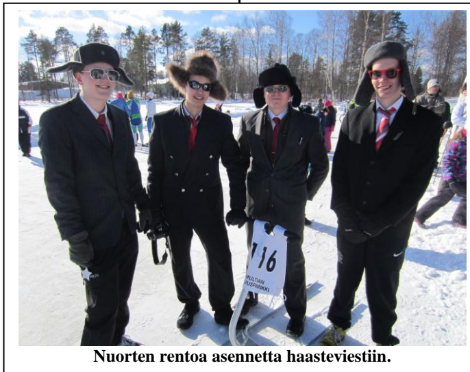
Nuorten rentoa asennetta haasteviestiin.

pitänyt olla jäykemmät suunnistuspiikkarit tai pesäpallopiikkarit? Kaikki lajit menevät joskus hifistelyksi, niin kelkkailukin, kun kilpaillaan kymmenesosasekunneista ja silloin on oikealla potkutekniikallakin merkitystä.